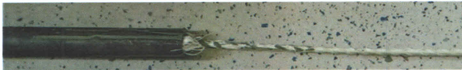
Слика 3: Изглед узорка по окончању испитивања