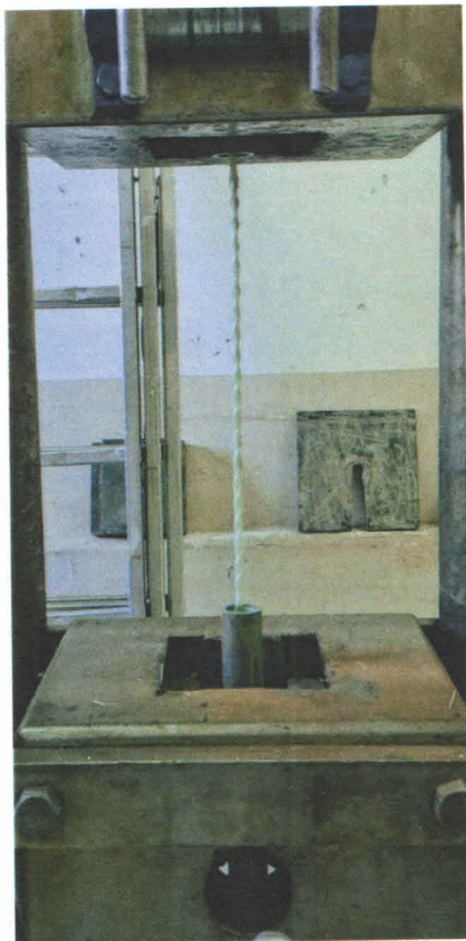
Слика 2: Један од узорка пречника \varnothing 8 mm пре испитивања